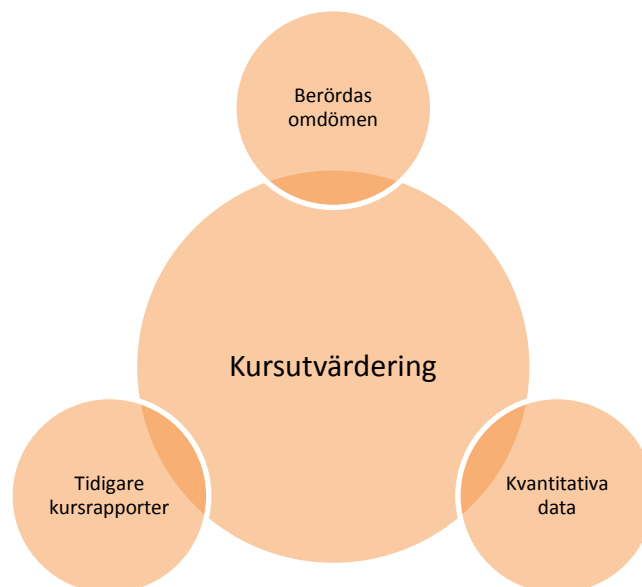
Figur 2. Kursutvärderingens olika delar