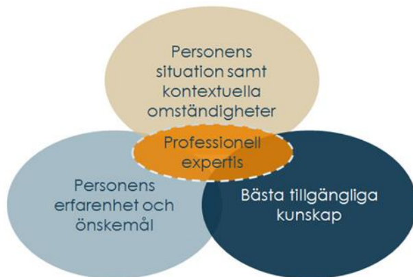
Figur 1: Evidensbaserad praktik i socialtjänsten. Socialstyrelsens kunskapsguide (Socialstyrelsen 2016).