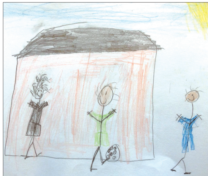
22 barn på Byttorpskolan ritade teckningar på temat "Jag och mina kompisar på rast" och intervjuades sedan om vänskap utifrån teckningarna.