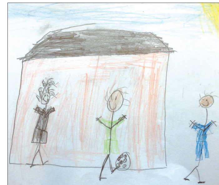
22 barn på Byttorpskolan ritade teckningar på temat "Jag och mina kompisar på rast" och intervjuades sedan om vänskap utifrån teckningarna.